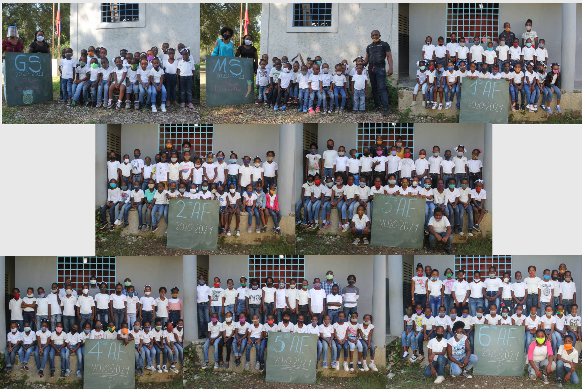
Nos classes maternelles et primaires pour cette année scolaire 2020/2021