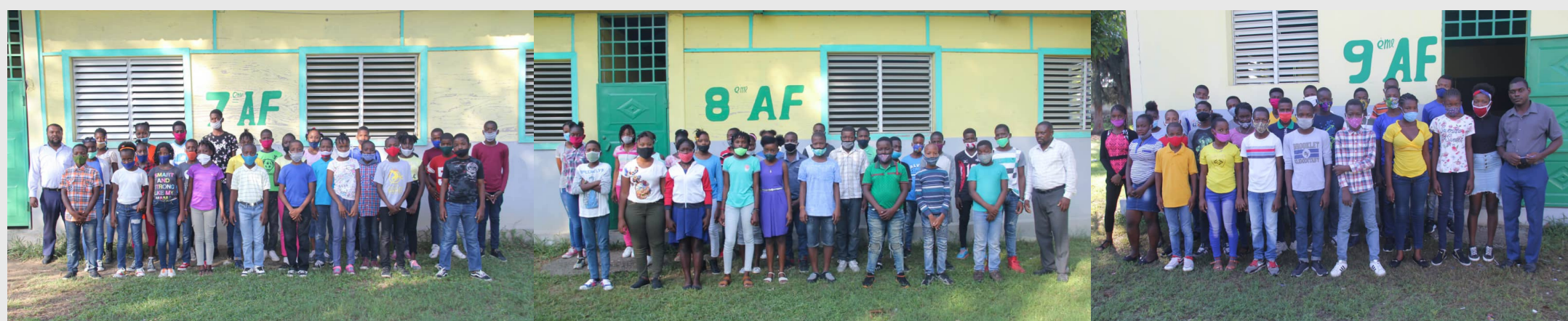
Nos années collèges 2020/2021