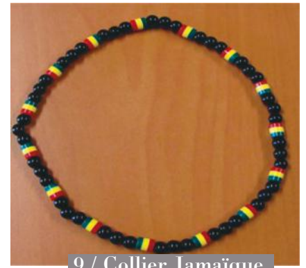
9 / Collier Jamaïque