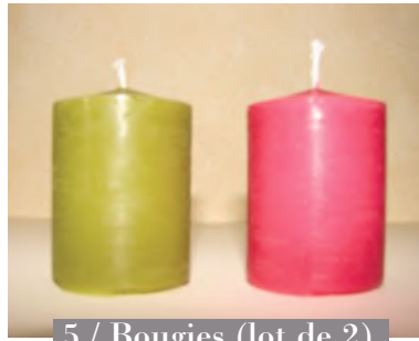
5 / Bougies (lot de 2)