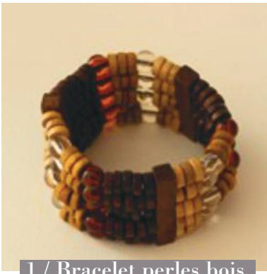
1 / Bracelet perles bois