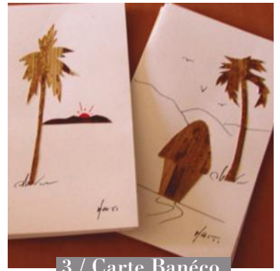
3 / Carte Banéco