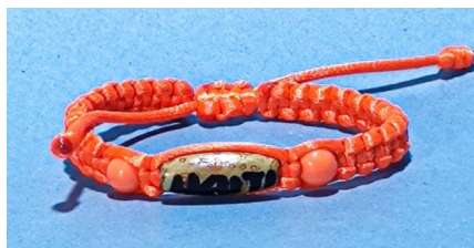
7 Bracelet tressé orange Haïti