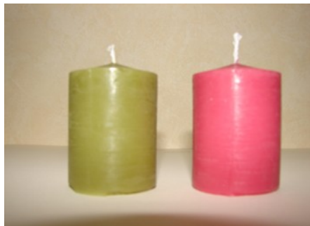
5 Bougies (lot de 2)