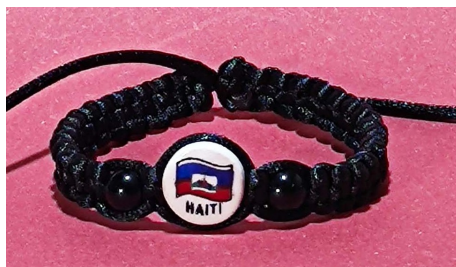
8 Bracelet tressé noir Haïti