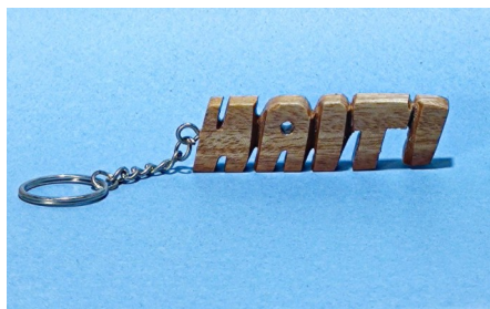
2 Porte clé Haiti