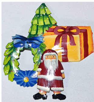
14 Décoration de Noël Lot de 4