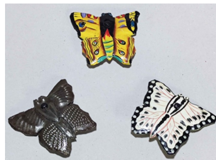
16 Broche ou magnet papillon