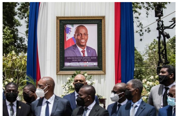
Des responsables assistent à une cérémonie en l'honneur du président, haïtien Jovenel Moïse, à Port-au-Prince, Haïti, le 20 juillet 2021.

Sur le papier, les auteurs de l'attaque ont été arrêtés affirment les autorités publiques : vingt-trois hommes, parmi lesquels dix-huit anciens militaires colombiens, trois Haïtiens et deux binationaux haïtiano-américains. (Cf du journal « Le Monde »)