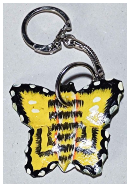
15 Porte clé papillon