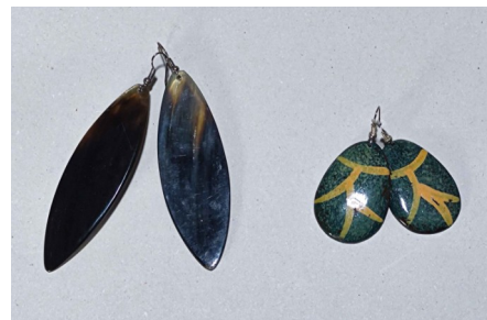
6 Boucles d'oreilles corne ou colorées