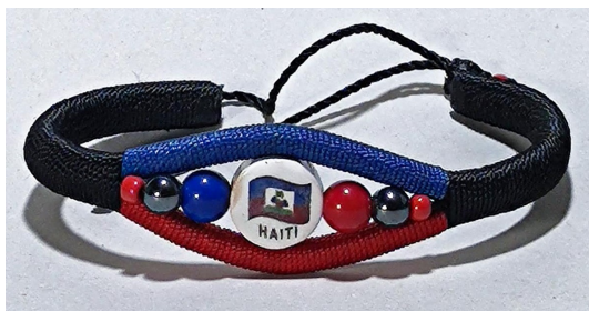
11 Bracelet noir bleu rouge Haïti