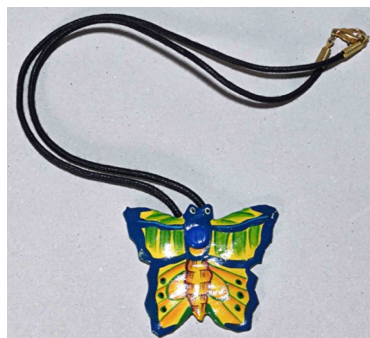
13 Collier papillon