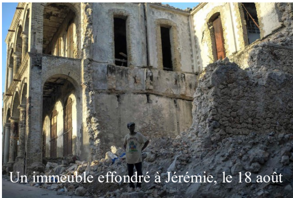
Un immeuble effondré à Jérémie, le 18 août

Le 14 août, le sud d'Haïti était ravagé par un puissant séisme de magnitude 7,2 sur l'échelle de Richter. Plus de 2 200 personnes ont été tuées dans la catastrophe et près de 13 000 ont été blessées. L'aide humanitaire continue d'être apportée sur l'île.