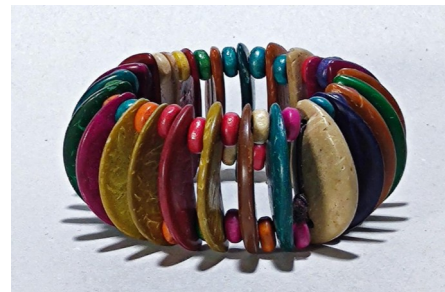
3 Bracelet multicolore