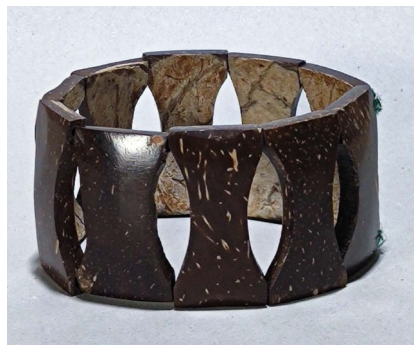
4 Bracelet Bois