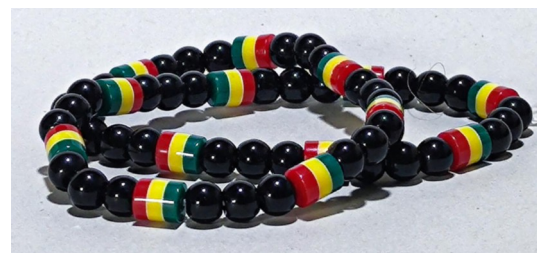
9 Collier couleur Jamaïque