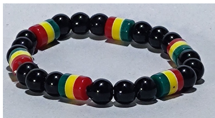
10 Bracelet couleur Jamaïque