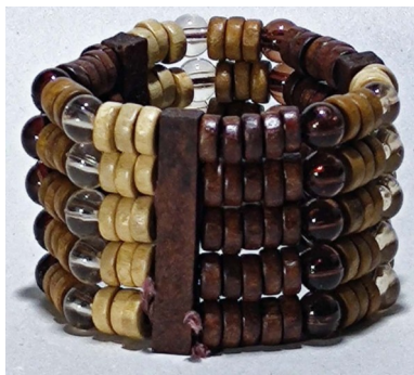
1 Bracelet perles bois